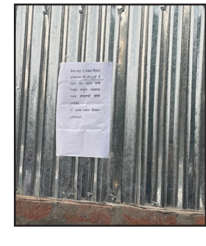
ਐਮਥਾਈ ਨਿਰਮਾਣ ਢਾਂਚੇ ਦਿੱਤੇ ਗਏ। ਹਾਲਾਂਕਿ ਵਿਚਕਾਰ ਕੰਮ ਰੁਕਣ ਨਾਲ ਇਹ ਸਵਾਲ ਖੜਾ ਹੋ ਗਿਆ ਹੈ ਕਿ ਕੀ ਪ੍ਰਸ਼ਾਸਨੀ ਦਬਾਅ ਫਿਰ ਤੋਂ ਢੀਲਾ ਪੈ ਜਾਵੇਗਾ? ਸਰੋਤ ਦੱਸਦੇ ਹਨ ਕਿ ਕਾਲੋਨੀ ਦੇ ਸੰਚਾਲਕ ਹੁਣ ਕਾਗਜ਼ੀ ਕਾਰਵਾਈ ਪੂਰੀ ਕਰਨ ਲਈ ਦੌੜ-ਦੌੜ ਕਰ ਰਹੇ ਹਨ। ਪਰ ਸ਼ਹਿਰ ਦੇ ਵਿਕਾਸ ਨਾਲ ਜੁੜੇ ਮਾਹਿਰਾਂ ਦਾ ਕਹਿਣਾ ਹੈ ਕਿ ਸਿਰਫ਼ ਫ਼ੀਸ ਭਰਨ ਨਾਲ ਗੈਰਕਾਨੂੰਨੀ ਕੰਮ ਕਾਨੂੰਨੀ ਨਹੀਂ ਬਣ ਜਾਂਦਾ। ਜਦ ਤੱਕ ਲੋਅਊਟ ਪਾਸ ਨਾ ਹੋਵੇ ਅਤੇ ਸੜਕ, ਸੀਵਰ, ਪਾਣੀ, ਡਰੇਨੇਜ ਵਰਗੀਆਂ ਸਹੂਲਤਾਂ ਦੀ ਮਨਜ਼ੂਰੀ ਨਾ ਮਿਲੇ, ਕਿਸੇ ਵੀ ਤਰ੍ਹਾਂ ਦਾ ਨਿਰਮਾਣ ਗੈਰਕਾਨੂੰਨੀ ਹੀ ਮੰਨਿਆ ਜਾਵੇਗਾ।