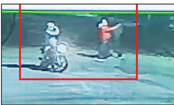
ਫਾਇਰਿੰਗ ਕਰਦੇ ਹੋਏ ਆਰੋਪੀ