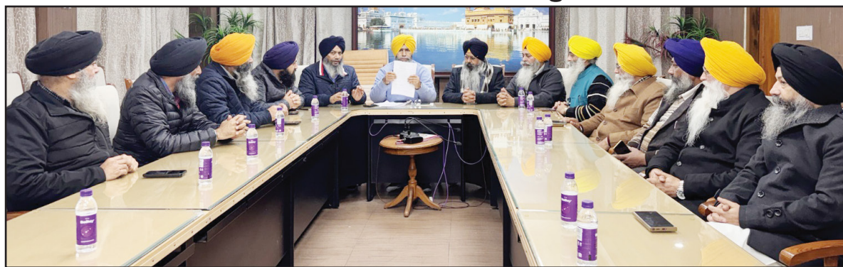
328 ਪਾਵਨ ਸਰੂਪਾਂ ਦੇ ਮਾਮਲੇ ਵਿੱਚ ਸੰਸਥਾ ਵੱਲੋਂ ਸਥਿਤੀ ਸਪਸ਼ਟ ਕਰਦੇ ਅਧਿਕਾਰੀ।