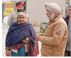
ਪੁਲਿਸ ਜਾਂਚ ਕਰਦੀ।

ਪੰਜਾਬ ਦੇ ਪਠਾਨਕੋਟ ਜ਼ਿਲ੍ਹੇ ਦੇ ਘਰੇਲੇ ਰੋਡ ਸਥਿਤ ਪਿੰਡ ਤਾਜਪੁਰ ਦੇ ਨੇੜੇ ਦੇਰ ਰਾਤ ਉਸ ਵੇਲੇ ਅਫ਼ਰਾ-ਤਫ਼ਰੀ ਮਚ ਗਈ, ਜਦੋਂ ਇੱਕ ਗੱਡੀ ਵਿੱਚ ਸਵਾਰ ਅਣਪਛਾਤੇ ਵਿਅਕਤੀ ਨੇ ਹਵਾਈ ਫਾਇਰਿੰਗ ਕਰ ਦਿੱਤੀ। ਇਹ ਪੂਰੀ ਘਟਨਾ ਨੇੜੇ ਲੱਗੇ ਸੀਸੀਟੀਵੀ ਕੈਮਰੇ ਵਿੱਚ ਕੈਦ ਹੋ ਗਈ ਹੈ। ਗੋਲੀ ਚੱਲਣ ਦੀ ਆਵਾਜ਼ ਨਾਲ ਇਲਾਕੇ ਵਿੱਚ ਦਹਿਸ਼ਤ ਦਾ ਮਾਹੌਲ ਬਣ ਗਿਆ, ਜਿਸ ਤੋਂ ਬਾਅਦ ਪਿੰਡ ਵਾਸੀਆਂ ਨੇ ਤੁਰੰਤ