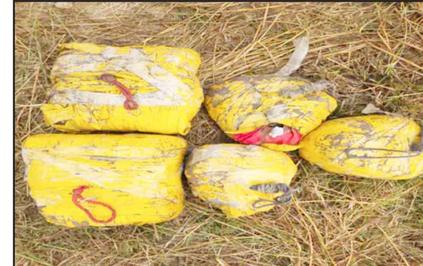
ਜ਼ਬਤ ਕੀਤੀ ਗਈ ਹੈਰੋਇਨ।