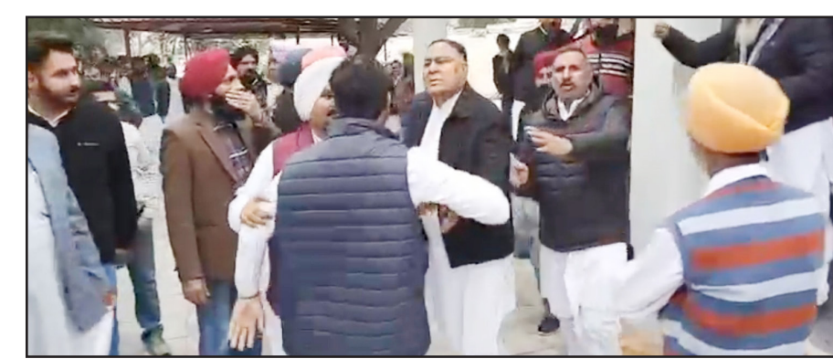
ਕਾਂਗਰਸੀ ਵਰਕਰ ਹੰਗਾਮਾ ਕਰਦੇ ਹੋਏ।