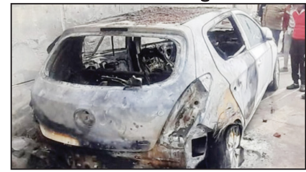
ਸਮਰ ਨਿਊਜ਼ | ਲੁਧਿਆਣਾ

ਮੰਨਾ ਸਿੰਘ ਨਗਰ ਸਥਿਤ ਇੱਕ ਫੈਕਟਰੀ ਦੇ ਬਾਹਰ ਪਾਰਕ ਕੀਤੀ ਆਈ-20 ਕਾਰ ਵਿੱਚ ਅਚਾਨਕ ਅੱਗ ਲੱਗ ਗਈ। ਅੱਗ ਇੰਨੀ ਭਿਆਨਕ ਸੀ ਕਿ ਉੱਥੋਂ ਲੰਘ ਰਹੀਆਂ ਹਾਈ ਵੋਲਟੇਜ ਤਾਰਾਂ ਵੀ ਇਸ ਦੀ ਚਪੇਟ ਵਿੱਚ ਆ ਗਈਆਂ। ਘਟਨਾ ਦੀ ਜਾਣਕਾਰੀ ਮਿਲਦੇ ਹੀ ਇਲਾਕੇ ਵਿੱਚ ਅਫਰਾ-ਤਫਰੀ ਮਚ ਗਈ। ਮੌਕੇ 'ਤੇ ਮੌਜੂਦ ਲੋਕਾਂ ਨੇ ਤੁਰੰਤ ਪੁਲਿਸ ਕੰਟਰੋਲ ਰੂਮ ਨੂੰ ਸੂਚਨਾ ਦਿੱਤੀ। ਸੂਚਨਾ ਮਿਲਣ ਉਪਰੰਤ ਫਾਇਰ ਬ੍ਰਿਗੇਡ ਦੀ ਗੱਡੀ ਮੌਕੇ 'ਤੇ ਪਹੁੰਚੀ ਅਤੇ ਕਰਮਚਾਰੀਆਂ ਨੇ ਕਾਫ਼ੀ ਮੁਸ਼ੱਕਤ ਤੋਂ ਬਾਅਦ ਅੱਗ 'ਤੇ ਕਾਬੂ ਪਾਇਆ। ਪੁੱਤਖਰਦਸ਼ੀਆਂ ਨੇ ਦੱਸਿਆ ਕਿ ਜੇ ਸਮੇਂ ਸਿਰ ਅੱਗ 'ਤੇ ਕਾਬੂ ਨਾ ਪਾਇਆ ਜਾਂਦਾ, ਤਾਂ ਨੇੜੇ ਸਥਿਤ ਫੈਕਟਰੀ ਨੂੰ ਵੀ ਭਾਰੀ ਨੁਕਸਾਨ ਹੋ ਸਕਦਾ ਸੀ। ਲੋਕਾਂ ਨੇ ਦੱਸਿਆ ਕਿ ਅੱਗ ਲੱਗਦੇ ਹੀ ਉਨ੍ਹਾਂ ਨੇ ਖੁਦ ਬਚਾਅ ਕਾਰਵਾਈ ਸ਼ੁਰੂ ਕਰ ਦਿੱਤੀ ਅਤੇ ਲੱਕੜ ਦੇ ਗੱਟਿਆਂ ਦੀ ਮਦਦ ਨਾਲ ਸੜ ਰਹੀ ਕਾਰ ਨੂੰ ਫੈਕਟਰੀ ਤੋਂ ਦੂਰ ਕਰ ਦਿੱਤਾ, ਜਿਸ ਨਾਲ ਇੱਕ ਵੱਡਾ ਹਾਦਸਾ ਟਲ ਗਿਆ। ਪੁੱਤਖਰਦਸ਼ੀਆਂ ਦੀ ਚਪੇਟ ਵਿੱਚ ਆ ਗਈਆਂ। ਘਟਨਾ ਦੀ ਜਾਣਕਾਰੀ ਮਿਲਦੇ ਹੀ ਇਲਾਕੇ ਵਿੱਚ ਅਫਰਾ-ਤਫਰੀ ਮਚ ਗਈ। ਮੌਕੇ 'ਤੇ ਮੌਜੂਦ ਲੋਕਾਂ ਨੇ ਤੁਰੰਤ ਪੁਲਿਸ ਕੰਟਰੋਲ ਰੂਮ ਨੂੰ ਸੂਚਨਾ ਦਿੱਤੀ। ਸੂਚਨਾ ਮਿਲਣ ਉਪਰੰਤ ਫਾਇਰ ਬ੍ਰਿਗੇਡ ਦੀ ਗੱਡੀ ਮੌਕੇ 'ਤੇ ਪਹੁੰਚੀ ਅਤੇ ਕਰਮਚਾਰੀਆਂ ਨੇ ਕਾਫ਼ੀ ਮੁਸ਼ੱਕਤ ਤੋਂ ਬਾਅਦ ਅੱਗ 'ਤੇ ਕਾਬੂ ਪਾਇਆ। ਪੁੱਤਖਰਦਸ਼ੀਆਂ ਨੇ ਦੱਸਿਆ ਕਿ ਜੇ ਸਮੇਂ ਸਿਰ ਅੱਗ 'ਤੇ ਕਾਬੂ ਨਾ ਪਾਇਆ ਜਾਂਦਾ, ਤਾਂ ਨੇੜੇ ਸਥਿਤ ਫੈਕਟਰੀ