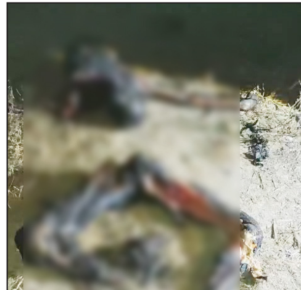
ਖਾਲੀ ਪਲਾਟ 'ਤੇ ਪਈ ਨੌਜਵਾਨ ਦੀ ਲਾਸ਼ - ਸਮਰ ਨਿਊਜ਼

ਬਾਣਾ ਮਹਿਰਬਾਨ ਦੇ ਅਧੀਨ ਪੈਂਦੇ ਪਿੰਡ ਖ਼ਵਾਜਕੇ ਵਿੱਚ ਸੋਮਵਾਰ ਸ਼ਾਮ ਉਸ ਵੇਲੇ ਸਨਸਨੀ ਫੈਲ ਗਈ, ਜਦੋਂ ਪਿੰਡ ਦੇ ਖੇਤਾਂ ਨਾਲ ਲੱਗਦੇ ਇੱਕ ਖਾਲੀ ਪਲਾਟ ਵਿੱਚ ਇੱਕ ਨੌਜਵਾਨ ਦੀ ਸੜੀ ਹੋਈ ਲਾਸ਼ ਪਈ ਹੋਣ ਦੀ ਸੂਚਨਾ ਮਿਲੀ। ਇੱਕ ਰਾਹਗੀਰ ਨੇ ਪਲਾਟ ਵਿੱਚ ਲਾਸ਼ ਪਈ ਦੇਖੀ ਤਾਂ ਤੁਰੰਤ ਸ਼ੋਰ ਮਚਾਇਆ, ਜਿਸ ਤੋਂ ਬਾਅਦ ਆਲੇ-ਦੁਆਲੇ ਦੇ ਲੋਕ ਮੌਕੇ 'ਤੇ ਇਕੱਠੇ ਹੋ ਗਏ। ਜਦੋਂ ਲੋਕਾਂ ਨੇ ਨੇੜੇ ਜਾ ਕੇ ਦੇਖਿਆ ਤਾਂ ਲਾਸ਼ ਬੁਰੀ ਤਰ੍ਹਾਂ ਸੜੀ ਹੋਈ ਸੀ ਅਤੇ ਵੱਖ-ਵੱਖ ਹਿੱਸਿਆਂ ਵਿੱਚ ਪਈ ਹੋਈ ਸੀ। ਪਿੰਡ ਵਾਸੀਆਂ ਨੇ ਤੁਰੰਤ ਮਾਮਲੇ ਦੀ ਸੂਚਨਾ ਪੁਲਿਸ ਨੂੰ ਦਿੱਤੀ, ਜਿਸ ਉਪਰੰਤ ਬਾਣਾ ਮਹਿਰਬਾਨ ਦੀ ਪੁਲਿਸ ਮੌਕੇ 'ਤੇ ਪਹੁੰਚੀ ਅਤੇ ਲਾਸ਼ ਨੂੰ ਕਬਜ਼ੇ ਵਿੱਚ ਲੈ ਕੇ ਜਾਂਚ ਸ਼ੁਰੂ ਕਰ ਦਿੱਤੀ। ਘਟਨਾ ਸਥਾਨ 'ਤੇ ਦੇਰ ਸ਼ਾਮ ਤੱਕ ਉੱਚ ਅਧਿਕਾਰੀਆਂ ਸਮੇਤ ਫੋਰੈਂਸਿਕ ਵਿਭਾਗ ਦੀ ਟੀਮ ਵੀ ਮੌਜੂਦ ਰਹੀ। ਫਿਲਹਾਲ ਲਾਸ਼ ਦੇ ਬੁਰੀ ਤਰ੍ਹਾਂ ਸੜੇ ਹੋਣ ਕਾਰਨ ਉਸਦੀ ਪਛਾਣ ਨਹੀਂ ਹੋ ਸਕੀ ਹੈ, ਜਿਸ ਕਾਰਨ ਲਾਸ਼ ਨੂੰ 72 ਘੰਟਿਆਂ ਲਈ ਸਿਵਲ ਹਸਪਤਾਲ ਦੀ ਮੋਰਚਰੀ ਵਿੱਚ ਰੱਖਵਾਇਆ ਗਿਆ ਹੈ। ਰਾਹਗੀਰ ਨੇ ਦੱਸਿਆ ਕਿ ਉਹ ਖੇਤਾਂ