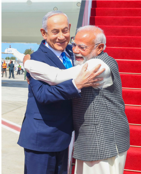
ਪ੍ਰਧਾਨ ਮੰਤਰੀ ਨਰਿੰਦਰ ਮੋਦੀ ਇਜ਼ਰਾਈਲ ਦੇ ਦੋ ਦਿਨਾਂ ਦੌਰੇ 'ਤੇ ਤੇਲ ਅਵੀਵ ਪਹੁੰਚੇ, ਜਿੱਥੇ ਉਨ੍ਹਾਂ ਦਾ ਸ਼ਾਨਦਾਰ ਸਵਾਗਤ ਕੀਤਾ ਗਿਆ।

ਦੇਸ਼ੀ | ਨਵੀਂ ਦਿੱਲੀ ਪ੍ਰਧਾਨ ਮੰਤਰੀ ਨਰਿੰਦਰ ਮੋਦੀ ਇਜ਼ਰਾਈਲ ਦੇ ਦੋ ਦਿਨਾਂ ਦੌਰੇ 'ਤੇ ਤੇਲ ਅਵੀਵ ਪਹੁੰਚੇ, ਜਿੱਥੇ ਉਨ੍ਹਾਂ ਦਾ ਸ਼ਾਨਦਾਰ ਸਵਾਗਤ ਕੀਤਾ ਗਿਆ। ਇਹ ਨੌਂ ਸਾਲਾਂ ਦੇ ਅੰਤਰਾਲ ਤੋਂ ਬਾਅਦ ਇਜ਼ਰਾਈਲ ਦਾ ਉਨ੍ਹਾਂ ਦਾ ਦੌਰਾ ਹੈ। ਉਹ ਆਖਰੀ ਵਾਰ ਜੁਲਾਈ 2017 ਵਿੱਚ ਗਏ ਸਨ। ਦੋਵਾਂ ਪ੍ਰਧਾਨ ਮੰਤਰੀਆਂ ਨੇ ਤੇਲ ਅਵੀਵ ਵਿੱਚ ਇੱਕ ਨਿੱਜੀ ਮੀਟਿੰਗ ਵੀ ਕੀਤੀ, ਜਿੱਥੇ ਉਨ੍ਹਾਂ ਨੇ ਦੁਵੱਲੇ ਸਬੰਧਾਂ ਨੂੰ ਮਜ਼ਬੂਤ ਕਰਨ, ਰੱਖਿਆ ਸਹਿਯੋਗ ਵਧਾਉਣ ਅਤੇ ਖੇਤਰੀ ਅਤੇ ਵਿਸ਼ਵਵਿਆਪੀ ਮੁੱਦਿਆਂ 'ਤੇ