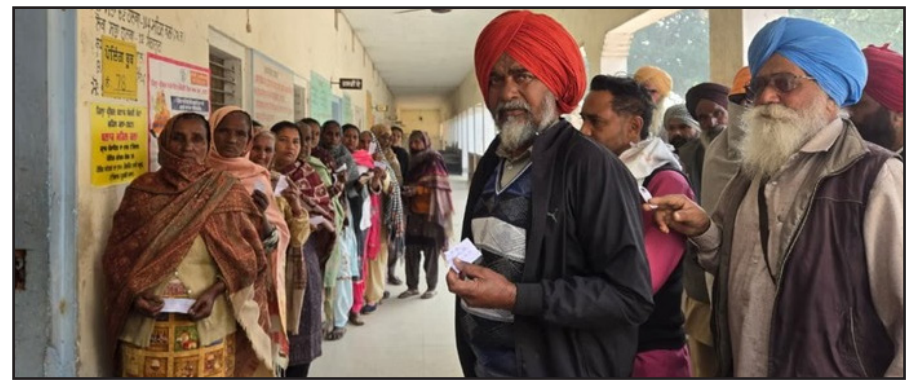
ਸਮਰ ਨਿਊਜ਼ | ਚੰਡੀਗੜ੍ਹ

ਪੰਜਾਬ ਵਿੱਚ ਜ਼ਿਲ੍ਹਾ ਪ੍ਰੀਸ਼ਦ ਅਤੇ ਬਲਾਕ ਸੰਮਤੀ ਚੋਣਾਂ ਲਈ ਵੋਟਿੰਗ ਸ਼ਾਂਤੀਪੂਰਵਕ ਸਮਾਪਤ ਹੋਈ। ਵੋਟਿੰਗ ਸਵੇਰੇ 8 ਵਜੇ ਸ਼ੁਰੂ ਹੋਈ ਅਤੇ ਸ਼ਾਮ 4 ਵਜੇ ਤੱਕ ਜਾਰੀ ਰਹੀ, ਵੋਟਰਾਂ ਨੇ ਈਵੀਐਮ ਦੀ ਬਜਾਏ ਬੈਲਟ ਪੇਪਰਾਂ ਰਾਹੀਂ ਆਪਣੇ ਵੋਟ ਦੇ ਅਧਿਕਾਰ ਦੀ ਵਰਤੋਂ ਕੀਤੀ। ਰਾਜ ਦੇ 23 ਜ਼ਿਲ੍ਹਿਆਂ ਵਿੱਚ 347 ਜ਼ਿਲ੍ਹਾ ਪ੍ਰੀਸ਼ਦ ਅਤੇ 2,838 ਬਲਾਕ ਸੰਮਤੀ ਸੀਟਾਂ 'ਤੇ ਚੋਣ ਲੜ ਰਹੇ ਕੁੱਲ 9,775 ਉਮੀਦਵਾਰਾਂ ਦੀ ਕਿਸਮਤ ਬੈਲਟ ਬਾਕਸਾਂ ਵਿੱਚ ਸੀਲ ਕਰ ਦਿੱਤੀ ਗਈ। ਰਾਜ ਭਰ ਵਿੱਚ ਦੁਪਹਿਰ 12 ਵਜੇ ਤੱਕ ਐਂਸਟਰ 19.1 ਪ੍ਰਤੀਸ਼ਤ ਵੋਟਿੰਗ ਦਰਜ ਕੀਤੀ ਗਈ, ਜਦੋਂ ਕਿ ਦੁਪਹਿਰ 2 ਵਜੇ ਤੱਕ 32% ਵੋਟਿੰਗ ਹੋਈ। ਹਾਲਾਂਕਿ, ਕਈ ਜ਼ਿਲ੍ਹਿਆਂ ਤੋਂ ਹਿੰਸਾ, ਵਿਵਾਦਾਂ, ਕਥਿਤ ਬੁਧ ਕੈਪਚਰਿੰਗ ਅਤੇ ਚੋਣ ਗਲਤੀਆਂ ਦੀਆਂ ਰਿਪੋਰਟਾਂ ਨੇ ਲੋਕਤੰਤਰ ਦੇ ਇਸ ਮਹੱਤਵਪੂਰਨ ਅਭਿਆਸ