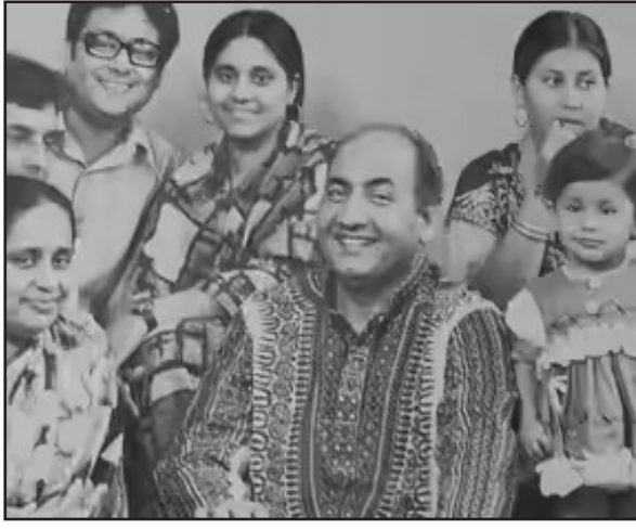
ਨੇ ਦੱਸਿਆ ਕਿ 1953 ਵਿੱਚ, ਜਦੋਂ ਰਫ਼ੀ ਅੰਮ੍ਰਿਤਸਰ ਦੇ ਅਲੈਗਜ਼ੈਂਡਰ ਗਰਾਊਂਡ ਵਿੱਚ ਪ੍ਰਦਰਸ਼ਨ ਕਰਨ ਆਏ ਸਨ, ਤਾਂ ਪਿੰਡ ਵਾਲੇ ਉਨ੍ਹਾਂ ਨੂੰ ਮਿਲਣ