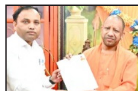
ਅਪੀਲ ਕੀਤੀ। ਉੱਤਰ ਪ੍ਰਦੇਸ਼ ਸਮੇਤ 12 ਰਾਜਾਂ ਅਤੇ ਕੇਂਦਰ ਸ਼ਾਸਿਤ ਪ੍ਰਦੇਸ਼ਾਂ ਵਿੱਚ ਚੱਲ ਰਹੇ ਵਿਸ਼ੇਸ਼ ਗਹਿਰੇ ਪੁਨਰੀਖਣ ਅਭਿਆਨ ਦੌਰਾਨ, ਮੰਗਲਵਾਰ ਨੂੰ ਮੁੱਖ ਮੰਤਰੀ ਨੇ ਗਿਣਤੀ ਫਾਰਮ ਭਰ ਕੇ ਅਗਲੀ ਕਾਰਵਾਈ ਲਈ ਅਧਿਕਾਰੀਆਂ

ਯੋਗੀ ਆਦਿਤਿਆਨਾਥ ਨੇ ਗੋਰਖਪੁਰ ਵਿੱਚ ਵਿਸ਼ੇਸ਼ ਗਹਿਰਾ ਪੁਨਰੀਖਣ (ਐਸਆਈਆਰ) ਅਭਿਆਨ ਤਹਿਤ ਆਪਣਾ ਗਿਣਤੀ ਫਾਰਮ ਖੁਦ ਭਰ ਕੇ ਮਤਦਾਤਾ ਸੂਚੀ ਸ਼ੁੱਧੀਕਰਨ ਪ੍ਰਕਿਰਿਆ ਨੂੰ ਤੇਜ਼ੀ ਦਿੱਤੀ। ਉਨ੍ਹਾਂ ਨੇ 'ਸੱਤਿਆਪਿਤ ਮਤਦਾਤਿਆਂ' ਨੂੰ ਮਜ਼ਬੂਤ ਲੋਕਤੰਤਰ ਦੀ ਨੀਂਹ ਦੱਸਦਿਆਂ ਸਾਰੇ ਉੱਤਰ ਪ੍ਰਦੇਸ਼ ਵਾਸੀਆਂ ਨੂੰ ਇਹ ਫਾਰਮ ਭਰਨ ਦੀ