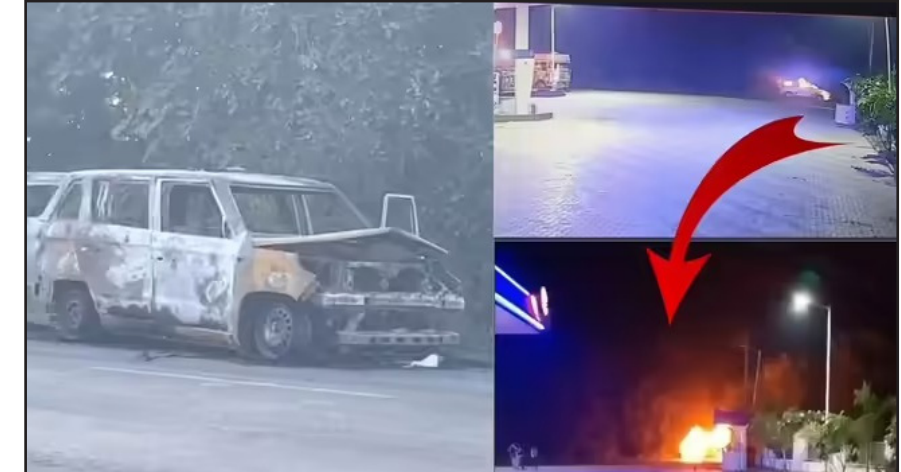
ਪੁਲਿਸ ਅਤੇ ਫਾਇਰ ਅਧਿਕਾਰੀਆਂ ਦੇ ਸ਼ੁਰੂਆਤੀ ਅਨੁਮਾਨ ਮੁਤਾਬਕ ਹਾਦਸੇ ਦਾ ਕਾਰਣ ਸ਼ਾਟ ਸਰਕਿਟ ਹੋ ਸਕਦਾ ਹੈ। ਸੀਸੀਟੀਵੀ ਫੁਟੇਜ ਵਿੱਚ ਵੇਖਿਆ ਗਿਆ ਕਿ ਗੱਡੀ ਵਿੱਚ ਅਚਾਨਕ ਤੇਜ਼ ਸਪਾਰਕਿੰਗ ਹੋਈ, ਜਿਸ ਤੋਂ ਤੁਰੰਤ ਬਾਅਦ ਅੱਗ ਦੀਆਂ ਲਪਟਾਂ ਨੇ ਪੂਰੀ ਐਂਬੂਲੈਂਸ ਨੂੰ ਆਪਣੀ ਲਪੇਟ ਵਿੱਚ ਲੈ ਲਿਆ। ਇਸ ਦੌਰਾਨ ਡਾਕਟਰ, ਨਰਸ ਅਤੇ ਨਵਜਾਤ ਦੇ ਪਿਤਾ ਨੂੰ ਬਾਹਰ ਨਿਕਲਣ ਦਾ ਮੌਕਾ ਵੀ ਨਹੀਂ ਮਿਲ ਸਕਿਆ।

ਬ੍ਰਿਗੇਡ ਦੀ ਤੁਰੰਤ ਕਾਰਵਾਈ ਨਾਲ ਪੈਟਰੋਲ ਪੰਪ ਨੂੰ ਵੱਡੇ ਨੁਕਸਾਨ ਤੋਂ ਬਚਾ ਲਿਆ ਗਿਆ। ਨਵਜਾਤ, ਉਸਦੇ ਪਰਿਵਾਰਕ ਮੈਂਬਰ ਅਤੇ ਮੈਡੀਕਲ ਟੀਮ ਦੇ ਸਦੱਸਾਂ ਦੀ ਮੌਤ ਨਾਲ ਪੂਰੇ ਇਲਾਕੇ ਵਿੱਚ ਸੋਗ ਦੀ ਲਹਿਰ ਦੌੜ ਗਈ ਹੈ। ਪੁਸ਼ਾਸਨ ਨੇ ਮ੍ਰਿਤਕਾਂ ਦੇ ਪਰਿਵਾਰਾਂ ਨੂੰ ਹਰ ਸੰਭਵ ਸਹਾਇਤਾ ਦੇਣ ਦਾ ਭਰੋਸਾ ਦਿੱਤਾ ਹੈ। ਇਸ ਹਾਦਸੇ ਨੇ ਐਂਬੂਲੈਂਸਾਂ ਦੀ ਸੁਰੱਖਿਆ ਮਿਆਰਾਂ ਅਤੇ ਨਿਯਮਿਤ ਤਕਨੀਕੀ ਜਾਂਚਾਂ 'ਤੇ ਗੰਭੀਰ ਸਵਾਲ ਖੜ੍ਹੇ ਕਰ ਦਿੱਤੇ ਹਨ। ਪੁਲਿਸ ਦਾ ਕਹਿਣਾ ਹੈ ਕਿ ਪੋਸਟਮਾਰਟਮ ਅਤੇ ਫੋਰੈਂਸਿਕ ਰਿਪੋਰਟ ਤੋਂ ਬਾਅਦ ਹੀ ਮੌਤ ਦੇ ਅਸਲ ਕਾਰਣਾਂ ਦੀ ਅਧਿਕਾਰਕ ਪੁਸ਼ਟੀ ਕੀਤੀ ਜਾਵੇਗੀ। ਫਿਲਹਾਲ ਮਾਮਲੇ ਦੀ ਗਹਿਰਾਈ ਨਾਲ ਜਾਂਚ ਜਾਰੀ ਹੈ।