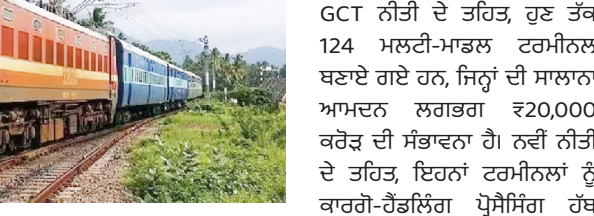
ਭਾਰਤੀ ਰੇਲਵੇ ਨੇ ਯਾਤਰੀ ਸਹੂਲਤਾਂ ਅਤੇ ਮਾਲ ਢੇਰਾ-ਢੁਆਈ ਵਿੱਚ ਇੱਕ ਵੱਡਾ ਬਦਲਾਅ ਸ਼ੁਰੂ ਕੀਤਾ ਹੈ। ਇਹ ਮੁਕਾਬਲਾ ਸੈਨਿਕਾਂ ਦੀਆਂ ਸਰੀਰਕ ਅਤੇ ਮਾਨਸਿਕ ਯੋਗਤਾਵਾਂ ਦੀ ਇੱਕ ਸਖ਼ਤ ਪ੍ਰੀਖਿਆ

ਸਮਰ ਨਿਊਜ਼ | ਨਵੀਂ ਦਿੱਲੀ ਭਾਰਤੀ ਰੇਲਵੇ ਨੇ ਯਾਤਰੀ ਸਹੂਲਤਾਂ ਅਤੇ ਮਾਲ ਢੇਰਾ-ਢੁਆਈ ਵਿੱਚ ਇੱਕ ਵੱਡਾ ਬਦਲਾਅ ਸ਼ੁਰੂ ਕੀਤਾ ਹੈ। ਰੇਲ ਮੰਤਰੀ ਅਸ਼ਵਨੀ ਵੈਸ਼ਨਵ ਨੇ ਸ਼ਨੀਵਾਰ ਨੂੰ ਇੱਕ ਪ੍ਰੈਸ ਕਾਨਫਰੰਸ ਵਿੱਚ ਕਿਹਾ ਕਿ ਅਨੁਸਾਰ 2026 ਨੂੰ ਸੁਧਾਰ ਦਾ ਸਾਲ ਐਲਾਨਦੇ ਹੋਏ 52 ਹਫ਼ਤਿਆਂ ਵਿੱਚ 52 ਸੁਧਾਰ ਲਾਗੂ ਕਰਨ ਦਾ ਟੀਚਾ ਰੱਖਿਆ ਹੈ। ਰੇਲਵੇ ਸੁਧਾਰ ਯੋਜਨਾ ਦੇ ਤਹਿਤ, ਜਨਰਲ ਕੋਚਾਂ ਨੂੰ ਹੁਣ ਨਿਯਮਤ ਤੌਰ 'ਤੇ ਸਫ਼ ਕੀਤਾ ਜਾਵੇਗਾ, ਬਿਲਕੁਲ ਏਸੀ ਅਤੇ ਸਲੀਪਰ ਕੋਚਾਂ ਵਾਂਗ। ਪਹਿਲਾਂ, ਰਿਜ਼ਰਵ ਕੋਚਾਂ ਨੂੰ ਮੁੱਖ ਤੌਰ 'ਤੇ ਸਫ਼ ਕੀਤਾ ਜਾਂਦਾ ਸੀ, ਜਦੋਂ ਕਿ ਜਨਰਲ ਕੋਚਾਂ ਨੂੰ ਨਜ਼ਰਅੰਦਾਜ਼ ਕੀਤਾ ਜਾਂਦਾ ਸੀ। ਪਹਿਲੇ ਪੜਾਅ ਵਿੱਚ, 80 ਲੱਖੀ ਦੂਰੀ ਦੀਆਂ ਟ੍ਰੇਨਾਂ ਦੀ ਚੋਣ ਕੀਤੀ ਗਈ ਹੈ। ਇਹ ਪ੍ਰਣਾਲੀ ਅਗਲੇ ਛੇ ਮਹੀਨਿਆਂ ਦੇ ਅੰਦਰ ਸਾਰੀਆਂ ਟ੍ਰੇਨਾਂ