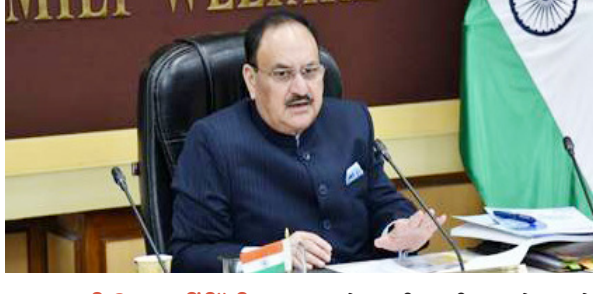
ਸਮਰ ਨਿਊਜ਼ | ਨਵੀਂ ਦਿੱਲੀ ਵਧੇਰੇ ਬੁਨਿਆਦੀ ਢਾਂਚੇ ਅਤੇ ਉਪਕਰਣਾਂ ਦੀ ਲਾਗਤ ਨੂੰ ਧਿਆਨ ਵਿੱਚ ਰੱਖਦੇ ਹੋਏ ਪ੍ਰਤੀ ਸੀਟ ਲਾਗਤ ਸੀਮਾ ਨੂੰ ₹1.50 ਕਰੜੇ ਤੱਕ ਵਧਾ ਦਿੱਤਾ ਗਿਆ ਹੈ। ਇਸ ਯੋਜਨਾ ਦੇ ਤਹਿਤ, ਮਾਹਰ ਡਾਕਟਰਾਂ ਦੀ ਘਾਟ ਨੂੰ ਪੂਰਾ ਕਰਨ ਲਈ 5,000 ਨਵੀਆਂ ਪੀਜੀ ਸੀਟਾਂ ਜੋੜੀਆਂ ਜਾਣਗੀਆਂ, ਜਦੋਂ ਕਿ ਸਰਕਾਰੀ ਮੈਡੀਕਲ ਕਾਲਜਾਂ, ਜਦੋਂ ਕਿ ਸਰਕਾਰੀ ਮੈਡੀਕਲ ਕਾਲਜਾਂ, ਅਤੇ ਅਪਗ੍ਰੇਡੇਸ਼ਨ ਦੁਆਰਾ 5,023 ਨਵੀਆਂ ਐਮਬੀਬੀਐਸ ਸੀਟਾਂ ਬਣਾਈਆਂ ਜਾਣਗੀਆਂ। ਰਾਜਾਂ ਅਤੇ ਕੇਂਦਰ ਸ਼ਾਸਤ ਪ੍ਰਦੇਸ਼ਾਂ ਨੂੰ ਵਿਸਤ੍ਰਿਤ ਪ੍ਰੋਜੈਕਟ ਰਿਪੋਰਟਾਂ ਅਤੇ ਪਾੜੇ ਦੇ ਵਿਸ਼ਲੇਸ਼ਣ ਜਮ੍ਹਾਂ ਕਰਾਉਣ ਲਈ ਕਿਹਾ ਗਿਆ ਹੈ। ਪੇਂਡੂ ਅਤੇ ਪਛੜੇ ਖੇਤਰਾਂ ਵਿੱਚ ਸੰਸਥਾਵਾਂ ਨੂੰ ਤਰਜੀਹ ਦਿੱਤੀ ਜਾਵੇਗੀ। ਸਰਕਾਰ ਦਾ ਕਹਿਣਾ ਹੈ ਕਿ ਇਸ ਨਾਲ ਡਾਕਟਰੀ ਸਿੱਖਿਆ ਤੱਕ ਪਹੁੰਚ ਵਧੇਗੀ ਅਤੇ ਦੇਸ਼ ਦੀ ਸਿਹਤ ਸੰਭਾਲ ਪ੍ਰਣਾਲੀ ਮਜ਼ਬੂਤ ਹੋਵੇਗੀ।