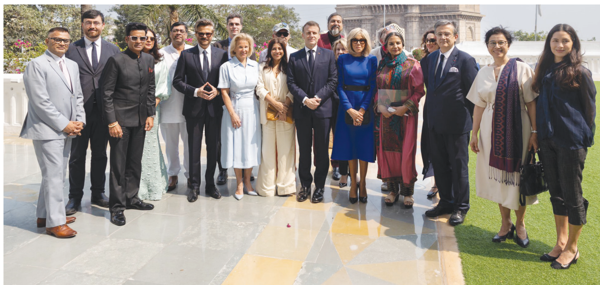
ਮੁੱਢਲੀ ਆਪਣੀ ਫੇਰੀ ਦੌਰਾਨ, ਫਰਾਂਸ ਦੇ ਰਾਸ਼ਟਰਪਤੀ ਇਮੈਨੂਅਲ ਮੈਕਰੋਨ ਨੇ ਭਾਰਤੀ ਫਿਲਮ ਉਦਯੋਗ ਦੀਆਂ ਪ੍ਰਮੁੱਖ ਹਸਤੀਆਂ ਨਾਲ ਮੁਲਾਕਾਤ ਕੀਤੀ। ਮਨੋਜ ਬਾਜਪਾਈ, ਅਨਿਲ ਕਪੂਰ, ਸ਼ਬਾਨਾ ਆਜ਼ਮੀ ਅਤੇ ਰਿਚਾ ਚੱਢਾ ਸਮੇਤ ਕਈ ਬਾਲੀਵੁੱਡ ਸਿਤਾਰੇ ਮੌਜੂਦ ਸਨ। ਮੀਟਿੰਗ ਦੌਰਾਨ ਸੱਭਿਆਚਾਰਕ ਸਹਿਯੋਗ ਅਤੇ ਸਿਨੇਮਾ ਰਾਹੀਂ ਭਾਰਤ-ਫਰਾਂਸ ਸਬੰਧਾਂ ਨੂੰ ਮਜ਼ਬੂਤ ਕਰਨ 'ਤੇ ਚਰਚਾ ਕੀਤੀ ਗਈ।