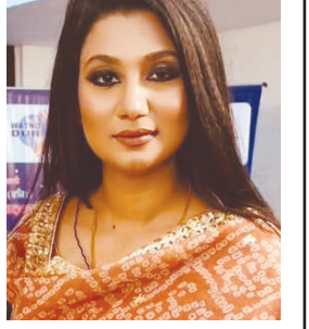
ਸਕਾਰਾਤਮਕ ਰਵੱਈਏ ਨਾਲ ਕਰੋ। ਤੁਹਾਡੇ ਯਤਨ ਸਫਲ ਹੋਣ, ਤੁਹਾਡੀ ਸਿਹਤ ਚੰਗੀ ਰਹੇ, ਅਤੇ ਤੁਹਾਡਾ ਚਿਹਰਾ ਸੰਤੁਸ਼ਟੀ ਅਤੇ ਖੁਸ਼ੀ ਨਾਲ ਭਰੇ। ਇਹ ਦਿਨ ਤੁਹਾਡੇ ਲਈ ਨਵੀਂ ਪ੍ਰੇਰਨਾ, ਨਵੀਂ ਊਰਜਾ, ਵਿਸ਼ਵਾਸ ਅਤੇ ਨਵੀਆਂ ਪ੍ਰਾਪਤੀਆਂ ਲਿਆਵੇ।

ਮੈਂ ਦਿਲੋਂ ਕਾਮਨਾ ਕਰਦਾ ਹਾਂ ਕਿ ਅੱਜ ਦਾ ਦਿਨ ਸ਼ਾਂਤੀ, ਊਰਜਾ ਅਤੇ ਸਕਾਰਾਤਮਕ ਸੋਚ ਨਾਲ ਭਰਿਆ ਹੋਵੇ। ਹਰ ਨਵੀਂ ਸਵੇਰ ਆਪਣੇ ਨਾਲ ਨਵੀਆਂ ਉਮੀਦਾਂ, ਨਵੇਂ ਸੁਪਨੇ ਅਤੇ ਤਰੱਕੀ ਦੇ ਅਣਗਿਣਤ ਮੌਕੇ ਲੈ ਕੇ ਆਉਂਦੀ ਹੈ। ਕੰਨ੍ਹੂ ਦੀਆਂ ਚਿੰਤਾਵਾਂ ਨੂੰ ਪਿੱਛੇ ਛੱਡੋ ਅਤੇ ਅੱਜ ਨੂੰ ਆਤਮਵਿਸ਼ਵਾਸ, ਧੀਰਜ ਅਤੇ ਮੁਸਕਰਾਹਟ ਨਾਲ ਗਲੇ ਲਗਾਓ। ਜ਼ਿੰਦਗੀ ਦੀਆਂ ਛੋਟੀਆਂ ਖੁਸ਼ੀਆਂ ਦਾ ਆਨੰਦ ਮਾਣੋ, ਆਪਣੇ ਅਜ਼ੀਜ਼ਾਂ ਨਾਲ ਬਿਤਾਏ ਹਰ ਪਲ ਨੂੰ ਸੰਭਾਲੋ, ਅਤੇ ਹਰ ਰੋਜ਼ ਆਪਣੇ ਟੀਚਿਆਂ ਵੱਲ ਇੱਕ ਛੋਟਾ ਪਰ ਮਜ਼ਬੂਤ ਕਦਮ ਚੁੱਕੋ। ਅੱਜ, ਆਪਣੇ ਮਨ ਨੂੰ ਸ਼ਾਂਤ ਰੱਖੋ, ਆਪਣੇ ਵਿਚਾਰਾਂ ਨੂੰ ਨਿਰਦੇਸ਼ਤ ਕਰੋ, ਅਤੇ ਹਰ ਕੰਮ ਨੂੰ ਇਮਾਨਦਾਰੀ, ਸਮਰਪਣ ਅਤੇ