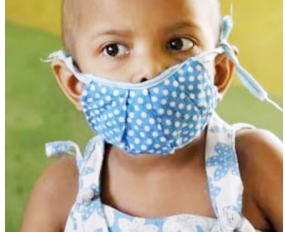
ਅੰਕੜਿਆਂ ਦੇ ਅਨੁਸਾਰ, ਭਾਰਤ ਵਿੱਚ ਹਰ ਸਾਲ 15 ਸਾਲ ਤੋਂ ਘੱਟ ਉਮਰ ਦੇ ਬੱਚਿਆਂ ਵਿੱਚ ਕੈਂਸਰ ਦੇ ਲਗਭਗ 50,000 ਨਵੇਂ ਕੇਸ ਪਾਏ ਜਾਂਦੇ ਹਨ, ਜੋ ਕਿ ਕੁੱਲ ਕੈਂਸਰ ਕੇਸਾਂ ਦਾ 3 ਤੋਂ 5 ਪ੍ਰਤੀਸ਼ਤ ਹੈ। ਵਿਸ਼ਵ ਪੱਧਰ 'ਤੇ, ਵਿਸ਼ਵ ਸਿਹਤ ਸੰਗਠਨ ਦੀ 2022 ਦੀ ਰਿਪੋਰਟ ਦੇ ਅਨੁਸਾਰ, 0-19 ਸਾਲ ਦੀ

ਸਮਰ ਨਿਊਜ਼ | ਨਵੀਂ ਦਿੱਲੀ ਕੈਂਸਰ ਦੁਨੀਆ ਭਰ ਵਿੱਚ ਇੱਕ ਗੰਭੀਰ ਅਤੇ ਘਾਤਕ ਬਿਮਾਰੀ ਵਜੋਂ ਤੇਜ਼ੀ ਨਾਲ ਫੈਲ ਰਿਹਾ ਹੈ, ਅਤੇ ਇਸਦਾ ਖ਼ਤਰਾ ਹੁਣ ਬੱਚਿਆਂ ਵਿੱਚ ਵੱਧ ਰਿਹਾ ਹੈ। ਸਿਹਤ ਮਾਹਿਰਾਂ ਦੇ ਅਨੁਸਾਰ, ਮਾੜੀਆਂ ਵਾਤਾਵਰਣਕ ਸਥਿਤੀਆਂ, ਪ੍ਰਦੂਸ਼ਣ, ਕੀਟਨਾਸ਼ਕਾਂ ਅਤੇ ਰਸਾਇਣਾਂ ਦੇ ਸੰਪਰਕ ਦੇ ਨਾਲ-ਨਾਲ, ਕੁਝ ਮਾਮਲਿਆਂ ਵਿੱਚ, ਜੈਨੇਟਿਕ ਕਾਰਕ, ਬੱਚਿਆਂ ਵਿੱਚ ਕੈਂਸਰ ਦੀਆਂ ਵਧਦੀਆਂ ਘਟਨਾਵਾਂ ਲਈ ਜ਼ਿੰਮੇਵਾਰ ਹਨ। ਅੰਤਰਰਾਸ਼ਟਰੀ ਬਾਲ ਕੈਂਸਰ ਦਿਵਸ 'ਤੇ ਸਾਲ 15 ਫਰਵਰੀ ਨੂੰ ਮਨਾਇਆ ਜਾਂਦਾ ਹੈ, ਜਿਸਦਾ ਉਦੇਸ਼ ਬਚਪਨ ਦੇ ਕੈਂਸਰ ਬਾਰੇ ਜਾਗਰੂਕਤਾ ਪੈਦਾ ਕਰਨਾ ਅਤੇ ਪ੍ਰਭਾਵਿਤ ਪਰਿਵਾਰਾਂ ਦਾ ਸਮਰਥਨ ਕਰਨਾ ਹੈ।