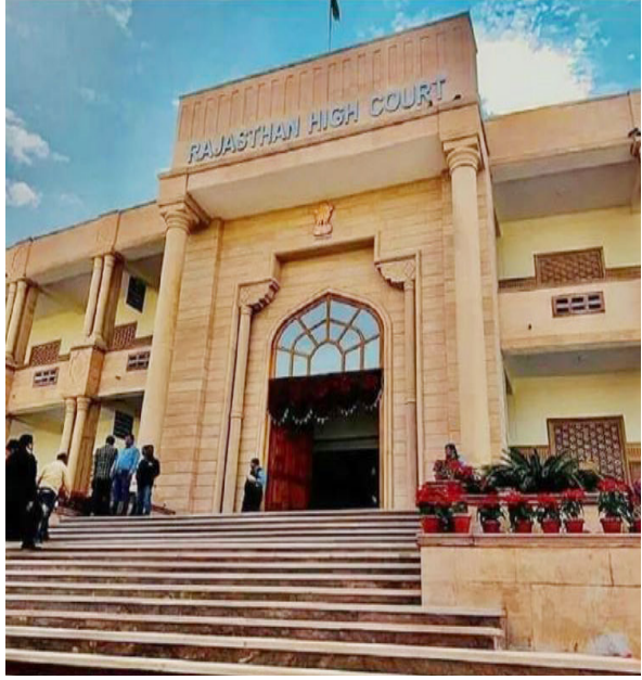
ਅਦਾਲਤ ਨੇ ਸਪੱਸ਼ਟ ਕੀਤਾ ਕਿ ਧਾਰਮਿਕ ਸਥਾਨਾਂ ਨੂੰ ਕੋਈ ਵਿਸ਼ੇਸ਼ ਛੋਟ ਨਹੀਂ ਦਿੱਤੀ ਜਾਵੇਗੀ ਅਤੇ ਸੁਪਰੀਮ ਕੋਰਟ ਦੇ ਹੁਕਮਾਂ ਦਾ ਹਵਾਲਾ ਦਿੰਦੇ ਹੋਏ ਕਿਹਾ ਕਿ ਜਨਤਕ ਸੜਕਾਂ 'ਤੇ ਧਾਰਮਿਕ ਕਬਜ਼ੇ ਵੀ ਹਟਾਏ ਜਾ ਸਕਦੇ ਹਨ। ਅਦਾਲਤ ਨੇ ਸੱਤ ਦਿਨਾਂ ਦੇ ਅੰਦਰ ਹਰੇਕ ਜ਼ਿਲ੍ਹੇ ਵਿੱਚ ਇੱਕ ਜ਼ਿਲ੍ਹਾ ਹਾਈਵੇਅ ਸੁਰੱਖਿਆ ਟਾਸਕ ਫੋਰਸ ਬਣਾਉਣ ਦਾ ਹੁਕਮ ਦਿੱਤਾ। ਇਸ ਟਾਸਕ ਫੋਰਸ