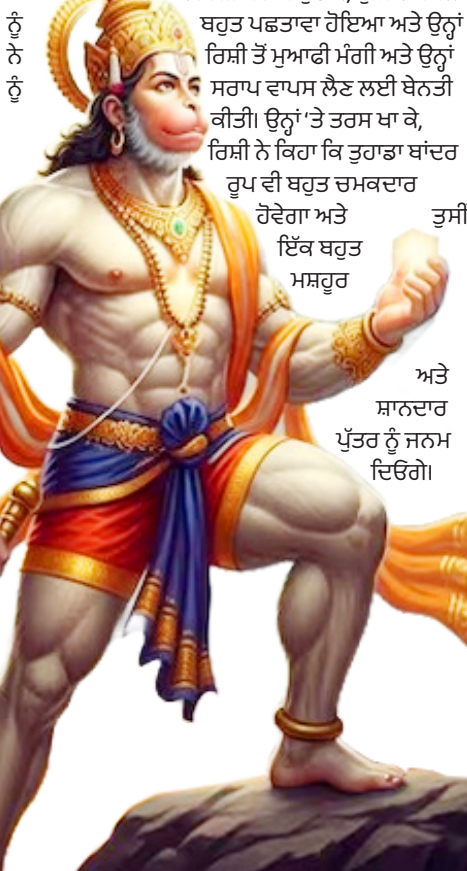
ਹਨੂੰਮਾਨ ਜੀ ਨੂੰ ਵਾਨਰ ਰੂਪ ਕਿਵੇਂ ਮਿਲਿਆ? ਹਨੂੰਮਾਨ ਜੀ ਨੂੰ ਪਵਨ ਪੁੱਤਰ ਵੀ ਕਿਹਾ ਜਾਂਦਾ ਹੈ ਅਤੇ

ਥਾਂਦਰ ਰਾਜਾ ਕੇਸਰੀ ਦਾ ਪੁੱਤਰ ਵੀ। ਦਰਾਅਲ, ਉਨ੍ਹਾਂ ਦੀ ਮਾਂ ਅੰਜਨੀ ਆਪਣੇ ਪਿਛਲੇ ਜਨਮ ਵਿੱਚ ਇੰਦਰਰਾਜ ਦੇ ਮਹਿਲ ਵਿੱਚ ਇੱਕ ਅਪਸਰਾ ਸੀ। ਉਨ੍ਹਾਂ ਦਾ ਨਾਮ ਪੁੰਜਿਕਾਸਥਲ ਸੀ। ਉਹ ਸੁਭਾਅ ਤੋਂ ਬਹੁਤ ਆਕਰਸ਼ਕ ਅਤੇ ਚੰਚਲ ਸੀ। ਇੱਕ ਵਾਰ ਆਪਣੀ ਚੰਚਲਤਾ ਕਾਰਨ, ਉਨ੍ਹਾਂ ਨੇ ਇੱਕ ਬਾਂਦਰ ਲਈ ਤਪੱਸਿਆ ਵਿੱਚ ਲੱਗੇ ਰਿਸ਼ੀ ਨੂੰ ਗਲਤ ਸਮਝ ਲਿਆ ਅਤੇ ਉਨ੍ਹਾਂ ਨਾਲ ਬਦਤਮੀਜ਼ੀ ਕੀਤੀ, ਫਿਰ ਰਿਸ਼ੀ ਨੇ ਗੁੱਸੇ ਵਿੱਚ ਉਨ੍ਹਾਂ ਨੂੰ ਸਰਾਪ ਦਿੱਤਾ ਕਿ ਉਹ ਇੱਕ ਬਾਂਦਰ ਅੰਤਰ ਦਾ ਰੂਪ ਧਾਰਨ ਕਰੇਗੀ। ਸਰਾਪ ਸੁਣ ਕੇ, ਪੁੰਜਿਕਾਸਥਲ ਬਹੁਤ ਪਛਤਾਵਾ ਹੋਇਆ ਅਤੇ ਉਨ੍ਹਾਂ ਰਿਸ਼ੀ ਤੋਂ ਮੁਆਫੀ ਮੰਗੀ ਅਤੇ ਉਨ੍ਹਾਂ ਸਰਾਪ ਵਾਪਸ ਲੈਣ ਲਈ ਬੇਨਤੀ ਕੀਤੀ। ਉਨ੍ਹਾਂ 'ਤੇ ਤਰਸ ਖਾ ਕੇ, ਰਿਸ਼ੀ ਨੇ ਕਿਹਾ ਕਿ ਤੁਹਾਡਾ ਬਾਂਦਰ ਰੂਪ ਵੀ ਬਹੁਤ ਚਮਕਦਾਰ ਹੋਵੇਗਾ ਅਤੇ ਤੁਸੀਂ ਇੱਕ ਬਹੁਤ ਮਸ਼ਹੂਰ ਅਤੇ ਸ਼ਾਨਦਾਰ ਪੁੱਤਰ ਨੂੰ ਜਨਮ ਦਿਓਗੇ।